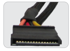
04 CONECTORES SATA