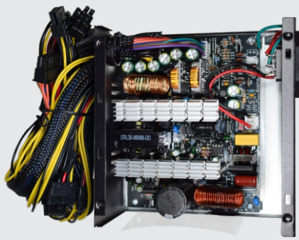
Smart design e componentes de primeira classe