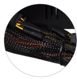
MALHA DE PROTEÇÃO DOS CABOS