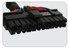
01 CONECTOR PARA PLACA MÃE ATX 20+4P