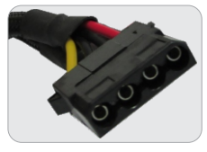
02 CONECTORES IDE