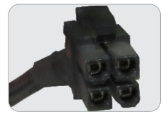
02 CONECTORES P4 12+12V