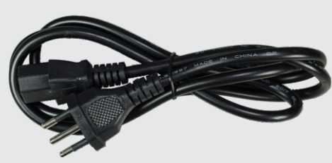
Cabo de força AC