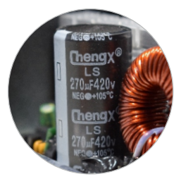
CAPACITOR ELETROLÍTICO (FILTRO DE ENTRADA)