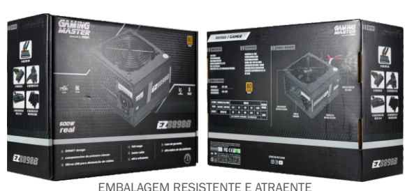
EMBALAGEM RESISTENTE E ATRAENTE