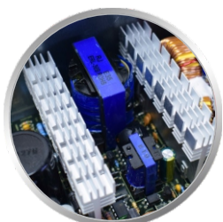
DISSIPADOR DE CALOR