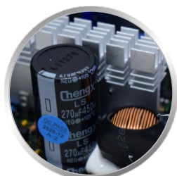
CAPACITOR ELETROLÍTICO (FILTRO DE ENTRADA)