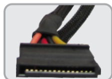
04 CONECTORES SATA