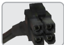
02 CONECTORES P4 12+12V