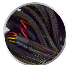
MALHA DE PROTEÇÃO DOS CABOS