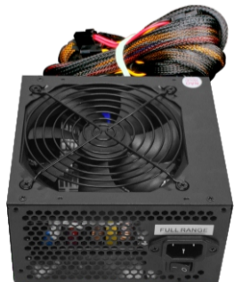
Fonte de alimentação gamer com um fan de 120mm para mais ventilação