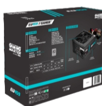
EMBALAGEM RESISTENTE E ATRAENTE