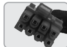
02 CONECTOR PCI-E 8P PARA PLACA DE VÍDEO