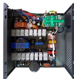
Smart design e componentes de primeira classe