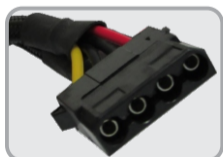
02 CONECTORES IDE